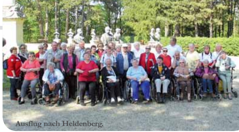
Ausflug nach Heldenberg

Die Bezirksstellen Gänserndorf und Groß-Enzersdorf des Roten Kreuzes veranstalten das ganze Jahr über Ausflüge im Zuge des Programmes „Betreutes Reisen“. Speziell ausgebildete freiwillige Mitarbeiterinnen und Mitarbeiter des Roten Kreuzes vermitteln dabei ein Gefühl von Sicherheit, Geborgenheit und die Gewissheit, in keiner Situation allein gelassen zu werden.